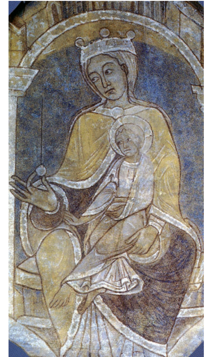
Peinture de la Vierge en Majesté