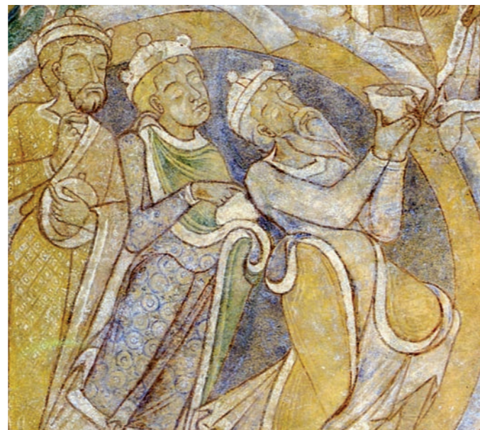
Scène de l'adoration des mages

Pour les peintures ainsi restaurées se pose alors le problème de leur repose dans la chapelle où l'humidité et les variations de température observées font craindre le pire pour la pérennité des œuvres restaurées. Celles-ci vont devoir attendre la fin des travaux de restauration de la chapelle et l'installation d'un système de chauffage permettant de maintenir une température constante dans le bâtiment. Après 20 années d'absence et d'efforts de la part du ministère de la culture et de la ville de Petit-Quevilly, les précieuses peintures réintègrent enfin la voûte de la chapelle Saint-Julien en 1983 et 1984.